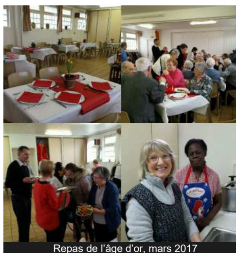
Repas de l'âge d'or, mars 2017