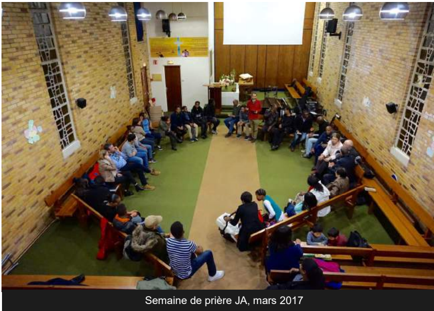
Semaine de prière JA, mars 2017